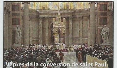
Vêpres de la conversion de saint Paul.