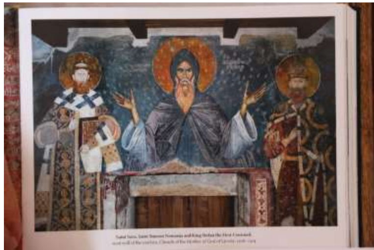
Saint Sava, Saint Siméon NEMANJA et le roi Stéfan dit « le premier couronné »