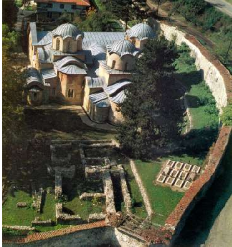
Peç – siège historique du Patriarcat de l’Eglise de Serbie