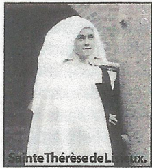
Sainte Thérèse de Lisieux

PRODUCTION ROME REPORTS. RÉALISATION JAVIER MARTINEZ BROCAL. Rediffusions : vendredi 03/10 à 7h50, vendredi 03/10 à 22h25, dimanche 05/10 à 16h05, lundi 06/10 à 14h30.